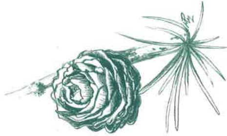
Pine du Mélèze

On dit ces forêts artificielles parce que les forestiers sont allés chercher des espèces non locales pour recoloniser les sols dénudés. Parmi elles citons le sapin de Douglas, venu d'Amérique, introduit en dernier pour reboiser les terres de culture sur sol acide. Plus haut, l'épicéa commun rappelle les paysages des Alpes du nord et du Jura. Les pins à crochets et laricio sont également présents, adaptés aux étages montagnards supérieurs. Enfin le mélèze, fournisseur d'un bois réputé imputrescible comme le douglas, est facilement reconnaissable à sa grande hauteur et ses fines aiguilles. En hiver il se repère plus facilement encore, c'est le seul conifère à perdre son feuillage.