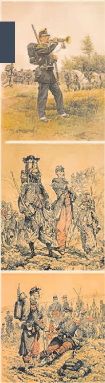
Chasseur à pieds Turcos Soldats d'Infanterie