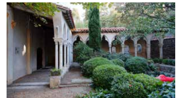
Cloître des Dominicains.