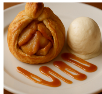
Aumonières de Pommes Tièdes Caramélisées & Glace Vanille