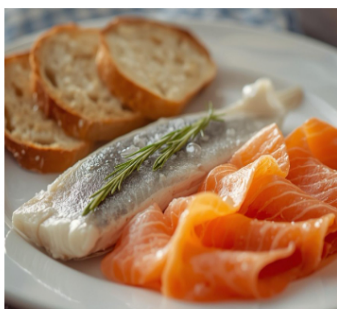
Duo de Truite et Saumon Fumé, Pain Suédois