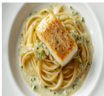
Corolle de Filet de Sole, Tagliatelles & Crème de Ciboulettes