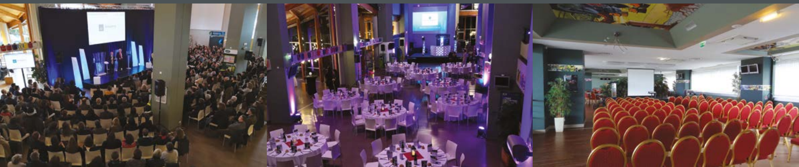
Le Salon Mississipi.