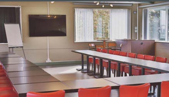
Le Salon Phebus.