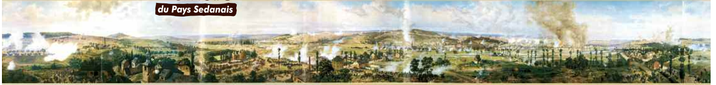
Panorama de la Bataille de 1870. Musée du Château fort