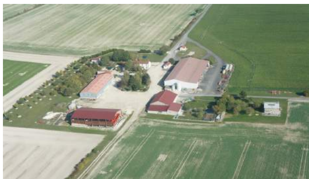
La ferme de Scay, 4 habitants

Le long de la départementale 977, vers Châlons en Champagne :