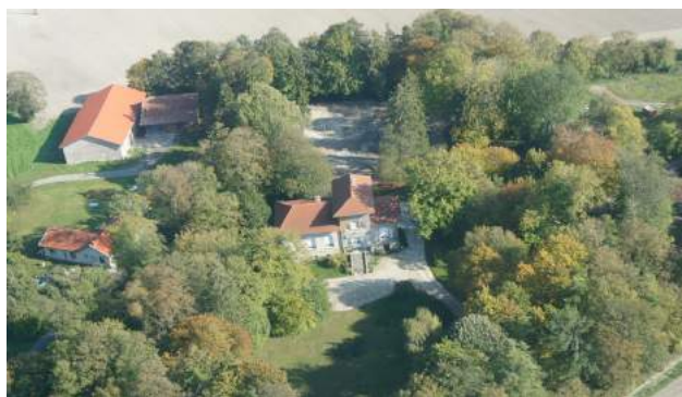
Baimont, 4 habitants

Palmarès de Semide au Concours National des Villes et Villages fleuris :