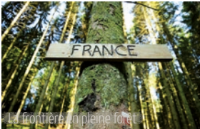
La frontière en pleine forêt