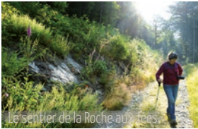
Le sentier de la Roche aux fées