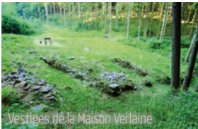
Vestiges de la Maison Verlainne