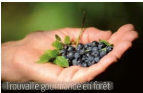
Trouvaille gourmande en forêt