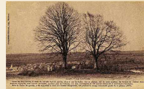
Illy - Le Calvaire

Ce fut la dernière grande charge de la cavalerie française dont la mémoire est conservée par le mémorial des Braves Gens.