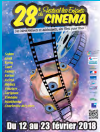
Affiche de l'édition 2018