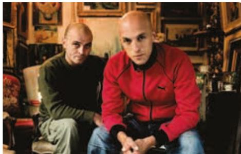
Festival Couleurs du Monde à Villeneuve d'Olmes