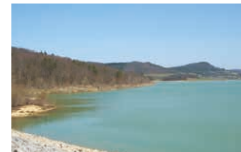
Lac de Montbel