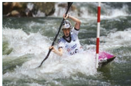
Canôe kayak à Foix