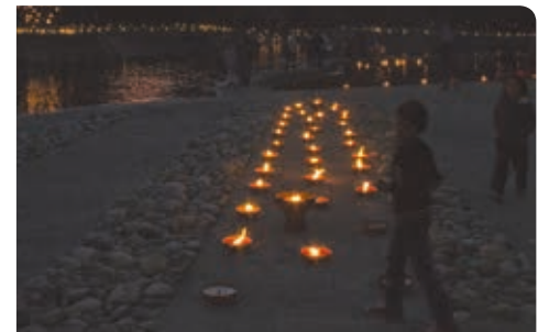
La Nuit de la Préhistoire à Tarascon sur Ariège