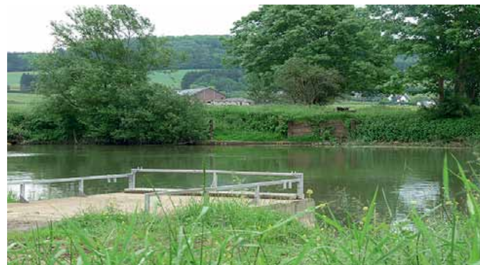
Ancien gué sur la Meuse