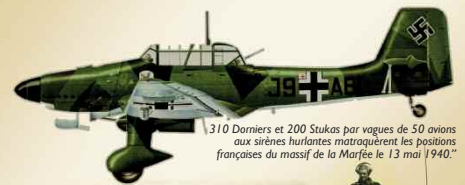
310 Dorniers et 200 Stukas par vagues de 50 avions aux sirènes hurlantes matraquèrent les positions françaises du massif de la Marfée le 13 mai 1940.

Am 13. bombardieren die Deutschen von 11 Uhr bis 15 Uhr ununterbrochen die französischen Posten auf dem Marfée-Massiv. Die Schüsse der französischen Artillerie werden auf der Stelle eingestellt. Im Laufe des Tages überqueren Sturmtruppen die Maas und erreichen Pont-Maugis, Frénois und Croix Piot. Am nächsten Tag, dem 14. Mai, folgen die Panzer des Generals Guderian, die das Hochplateau von la Marfée bis nach Bulson stürmen. Die Schlachten verschieben sich bis nach Stonne, wo ein entschiedener Widerstand die Front stecken bleiben lässt.