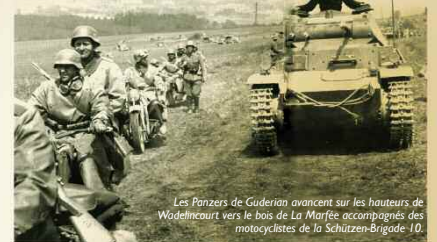
Les Panzers de Guderian avancent sur les hauteurs de Wadelincourt vers le bois de La Marfée accompagnés des motocyclistes de la Schützen-Brigade 10.