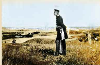
Moltke, Général en chef des Armées allemandes.