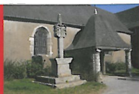
Église St Aignan