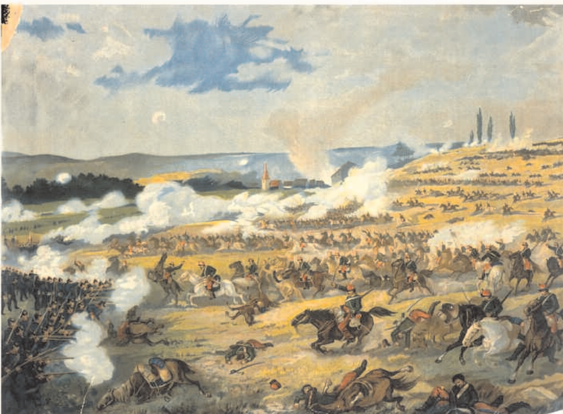
La célèbre charge commandée par Galliffet

En moins de deux heures, l'après-midi du 1er septembre 1870, lancés dans des charges de cavalerie hallucinantes, plus d'un millier d'entre eux tombent foudroyés par le feu intense des tirailleurs ennemis qui ont réussi à prendre position en rangs serrés à flanc de coteau du Terme.