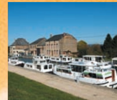
Base Ardennes Nautisme à Pont-à-Bar