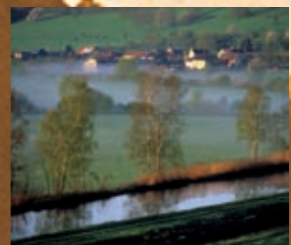
Onicourt - Canal des Ardennes