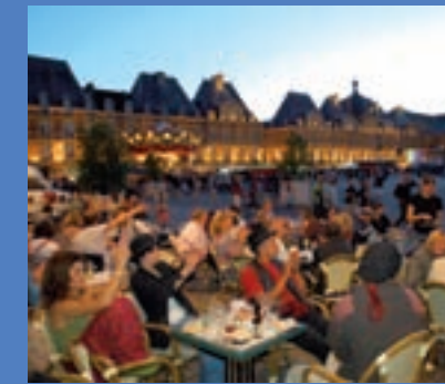
Place Ducale - Charleville-Mézières