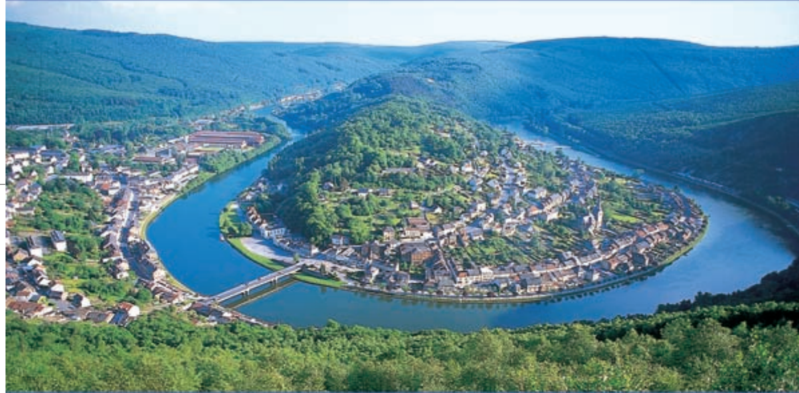
Méandre de Monthermé

Au départ de Pont-A-Bar, nombreuses formules : Week-end (2 jours) Mini-semaine (4 jours en semaine) Semaine (7 jours)