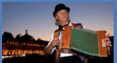
Charleville-Mézières - Festival des Marionnettes

Pont à Bar, Stenay, Dun sur Meuse, puis retour vers Pont à Bar