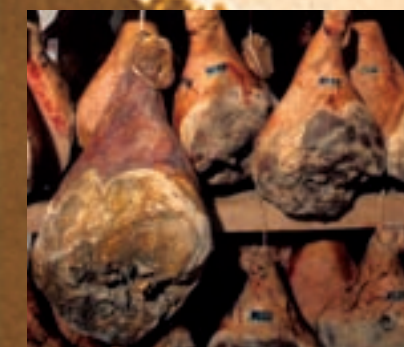
Jambon sec des Ardennes