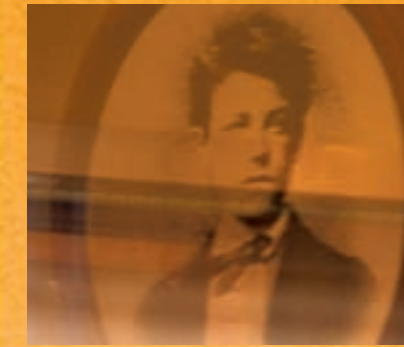
Musée Arthur Rimbaud

Tout au long de votre croisière, vous rencontrerez de nombreux témoins du passé historique et légendaire des Ardennes. Vos escales seront touristiques, gastronomiques ou sportives, vous savourerez les spécialités locales : jambon d'Ardenne, boudin blanc de Rethel, gibier, galette au sucre et bien sûr le Champagne.