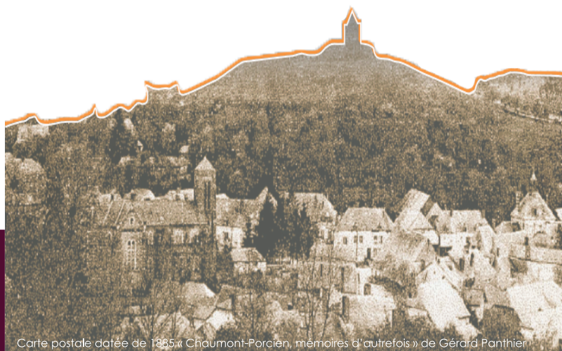
Carte postale datée de 1885 « Chaumont-Porcien, mémoires d'autrefois » de Gérard Panthier